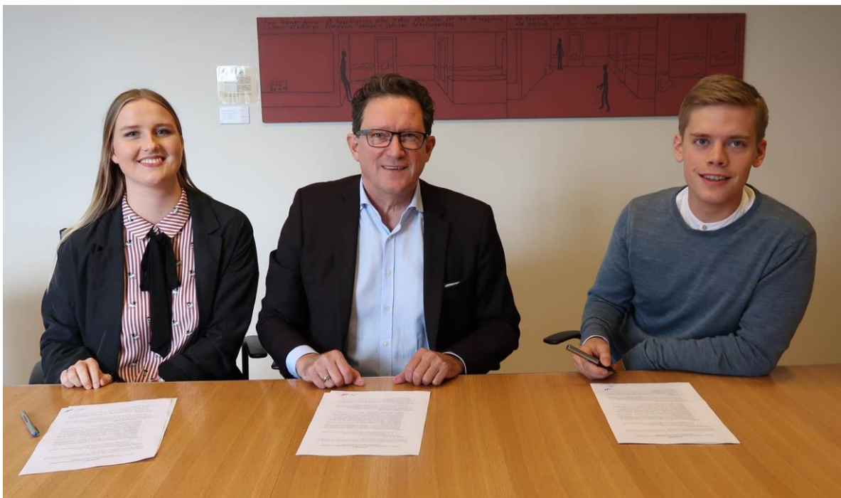
Í viðhengi: Samningur milli LÍS og MRN