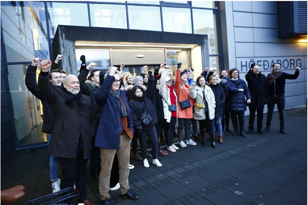
Viðhengi 8: Stuðningsyfirlýsing rektora

Áherslur stúdenta, hækkun frítekjumarks í 1.330.000 og hækkun framfærslu, var haldið mjög hátt á lofti af fulltrúum stúdenta í stjórn LÍN og þau eiga hrós skilið fyrir að hafa haldið stjórn stíft við efnið. Á samstöðufundinn safnaðist góður fjöldi stúdenta, sem og fulltrúar frá BHM og þingmenn frá Samfylkingunni og Pírötum. Úthlutunarreglur fengu fyrir vikið töluverða athygli, en enn er beðið eftir endanlegri niðurstöðu um reglur næsta árs og hvort þessar aðgerðir hafi verið til árangurs.